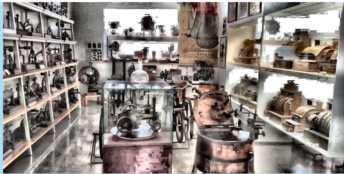
Exposició: Museu de la Tècnica de L'Empordà - Figueres Carrer dels Fossos, 12